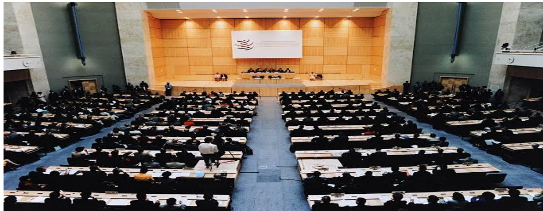
The World Trade Organization Ministerial Conference of 1998, in the Palace of Nations (Geneva, Switzerland).

2004, ஜூலை-30 ல் ஜெனிவாவில் நடைபெற்ற உலக வர்த்தக அமைப்பின் பொதுச்சபையின் கூட்டத்தில் பொது நிர்வாகி சமர்ப்பித்த புதிய வரைவுத் திட்டத்தை இந்தியா தலைமையிலான வளரும் நாடுகள் ஏற்றுக் கொள்ள மறுத்து விட்டன. ஆனாலும் இக் கூட்டத்தில் விவசாயம் மற்றும் அது தொடர்பான பிரச்சனைகள் பற்றி பேச்சு வார்த்தையைத் தொடர முடிவு செய்யப்பட்டது. இவ்வாறு உலக வர்த்தகக் கழகமும் பன்னாட்டு உறவில் முக்கியமான பங்கெடுத்து செயலாற்றி வருகிறது.