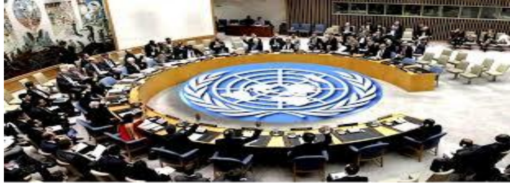
ஐக்கிய நாட்டு சபை

1945-ஆம் ஆண்டு சேன்பிரான்சிங்கோ என்ற இடத்தில் வைத்து ஐக்கிய நாட்டு சபை ஆரம்பிக்கப்பட்டது. ஐ.நா. சபை ஆரம்பிப்பதற்கு முன்னோடியாக உலக அரங்கில் பல மாநாடுகள் நடந்தேறின. சர்வதேச சங்கத்தின் குறைபாடுகளை நிவர்த்தி செய்யவும், போரைத் தவிர்க்கவும், பன்னாட்டுப் பிரச்சனைகளுக்கு சுமுகமான அளவில் தீர்வுகாணவும், உலகில் நாடுகளுக்கிடையே சமூக பொருளாதார ரீதியில் சம நிலையைத் தோற்றுவிக்கவும் பன்னாட்டு அளவில் ஒரு அமைப்பைத் தோற்றுவிக்கும் எண்ணம் இரண்டாம் உலகப் போர் நடைபெற்றுக் கொண்டிருக்கும் காலகட்டத்தில் உருவானது. இவ்வெண்ணத்தின் அடிப்படையில் நடந்தேறிய மாநாடுகள், உருவாக இருக்கும் பன்னாட்டு அமைப்பிற்கான கோட்பாட்டினை நிர்ணயிக்கும் நடவடிக்கைகளை மேற்கொண்டதோடு, அவ்வமைப்பின் துணைச் செயலாண்மைப் பிரிவுகளாகிய உணவு மற்றும் விவசாய அமைப்பு, வளர்ச்சிக்கான சர்வதேச வங்கி, சர்வதேச நிதி மற்றும் சர்வதேச நீதிமன்றம் போன்றவற்றைப் பற்றி ஆலோசித்தது.