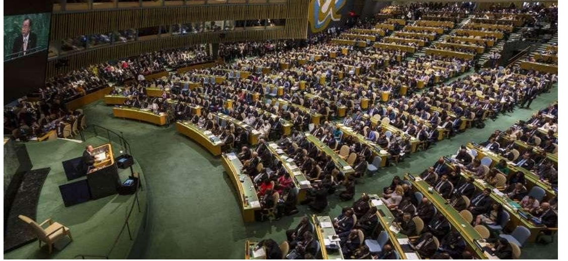
பன்னாட்டு உறவுகளின் கருத்தரங்க மாநாடு

பொதுவாக பன்னாட்டு உறவுகள் மற்றும் பன்னாட்டு அரசியல் (international politics) ஆகிய வார்த்தைகள் ஒரே பொருளில் பயன்படுவதைக் காணலாம். ஆனால் உண்மையில் இரண்டும் மாறுபட்ட பொருளில்தான் பயன்படுத்தப்பட வேண்டும். இரண்டு சொற்றொடர்களுக்கும் வேறுபாடுகள் உள்ளன. இந்த வேறு பாடுகளை பன்னாட்டு உறவுகள் பாடம் படிக்கும் மாணவர்கள் அறிந்து கொள்ள வேண்டும்.