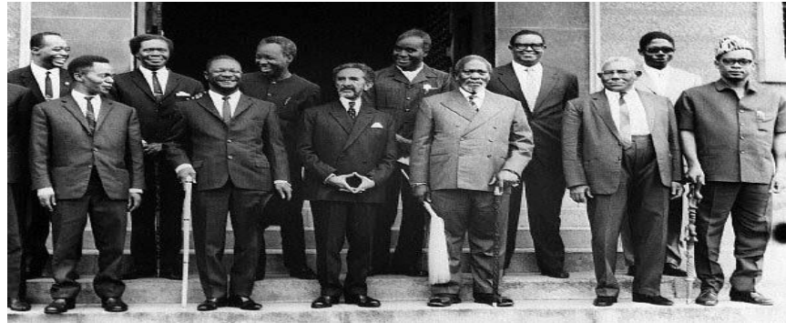
ஆப்பிரிக்காவில் இரண்டாம் உலகப் போருக்குப் பின்

இக்காலக்கட்டத்தில் ஆசியாவில் எழுந்த தேசிய உணர்வு, ஆப்பிரிக்காவிலும் தன் தாக்கத்தை ஏற்படுத்தியது. இந்த ஆசிய நாடுகளும் ஆப்பிரிக்க நாடுகளும் பொதுவான ஒரு வரலற்றை கொண்டிருக்கின்றன. மேலும் இவ்விரு கண்டங்களிலுள்ள மக்கள் தொகை, உலக மக்கள் தொகையில் ஒரு கணிசமான அளவுள்ளதாக இருக்கிறது. இதுகாறும் பன்னாட்டு