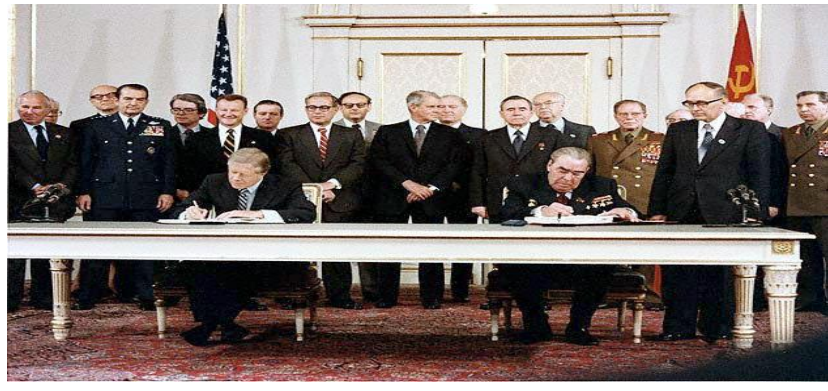
Jimmy Carter and Leonid Brezhnev signing the SALT II treaty, June 18, 1979, at the Hofburg Palace in Vienna.

சால்ட் 1ஐத் தொடர்ந்து பற்கான பேச்சுவார்த்தைகள் மேற்கொள்ளப்பட்டன. 1978-ஆம் ஆண்டு இது குறித்து வல்லரசுகள் ஓர் உடன்பாட்டிற்கு வந்தன. இதற்கிடையில் உலக அரசியலில் ஏற்பட்ட பல மாற்றங்களின் விளைவாக இவ்வொப்பந்தம் தற்காலிகமாக நிறுத்தி வைக்கப்பட்டது. ஆப்கானிஸ்தானத்தில் ரஷ்யர்களின் தலையீட்டைக் கண்டனம் செய்யும் வகையில் அமெரிக்க செனட் இவ்வொப்பந்தத்தை இதுகாறும் அங்கீகரிக்கவில்லை. இதன் பிறகு 1977-ம் ஆண்டு கார்ட்டர் அமெரிக்காவின் தலைவரானவுடன் NALT (Naval Armaments Limitation Treaty) சம்பந்தப்பட்ட பேச்சு வார்த்தைகளை துவக்கினார். குறிப்பாக, இந்தியப் பெருங்கடலை அமைதிப் பிரதேசமாக அறிவிப்பது குறித்து பேச்சு வார்த்தைகள், மேற்கொள்ளப்பட்டன. இதிலும் எந்தவிதமான வெற்றியும் காணப்படவில்லை .