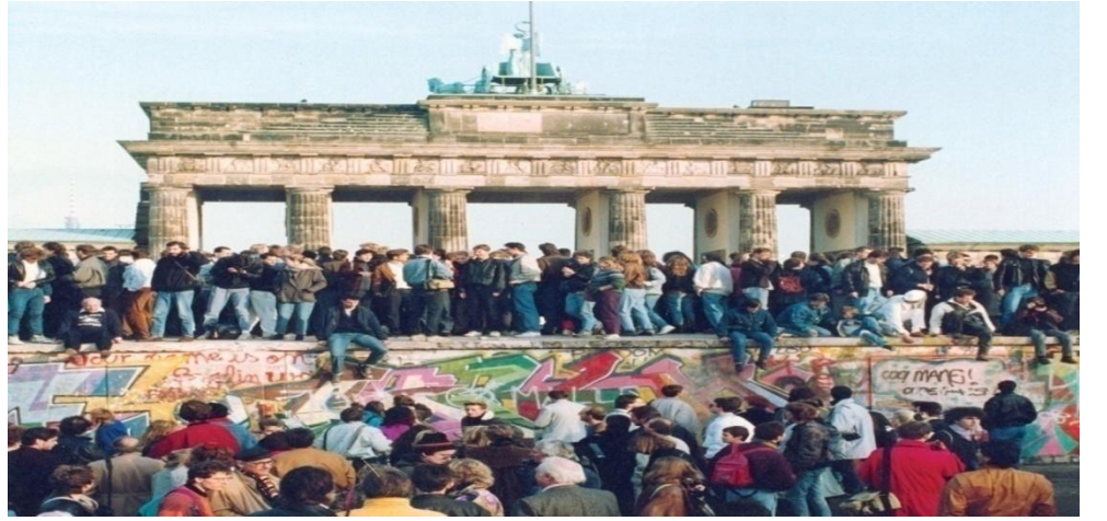
கிழக்கு மற்றும் மேற்கு பேர்லினிலிருந்து மக்கள் நவம்பர் 10 1989 அன்று பெர்லின் சுவரில் கூடி சுவர் திறந்து ஒரு நாள் கழிந்து

எதிர்த்தது. மேற்கு பெர்லினுக்கும் மேற்கு ஜெர்மனிக்கும் இடையிலான நீர், நில மார்க்கங்களை அடைத்துவிட்டது. இதனால் அங்கு வாழ்ந்த மக்களுக்கு உணவுப்பொருள் கிடைக்க வழியில்லாது போயிற்று. சகல தொடர்புகளிலிருந்தும் துண்டிக்கப்பட்ட மேற்கு பெர்லினுக்கு ஆகாயவழியாக மட்டும் தொடர்பு கொள்ள முடிந்தது. அமெரிக்கா தனது விமான பலத்தைப் பயன்படுத்தி மேற்கு பெர்லினில் வாழும் மக்களுக்கு அனைத்துப் பொருட்களையும் அனுப்பியது. 1948 - மேயில் தொடங்கிய பெர்லின் முற்றுகை 1949 மே வரை நீடித்தது. மேற்கு நாடுகள் அதனை உறுதியுடன் சமாளித்ததால் ரஷியா விட்டுக் கொடுத்தது. முற்றுகை தளர்த்தப்பட்டது. இந்த ஓராண்டு காலமும் பெர்லின் நகரில் அருகருகே இரு வல்லரசுகளும் பல தற்காப்பு படை நடவடிக்கைகளை எடுத்ததால் பதட்ட நிலை நீடித்தது. அதன் பின் மேலும் இரண்டு தடவை பெர்லின் நகரிலிருந்து மேற்கு வல்லரசுகளை வெளியேற்ற நிர்ப்பந்தங்களை மேற்கொண்டது. 1957-லிலும் 1961 லிலும் பெர்லின் நெருக்கடி ஏற்பட்டது. அப்போதும் மேற்கு வல்லரசுகள் உறுதியுடன் நின்றதால் ரஷியா விட்டுக் கொடுக்க நேர்ந்தது.