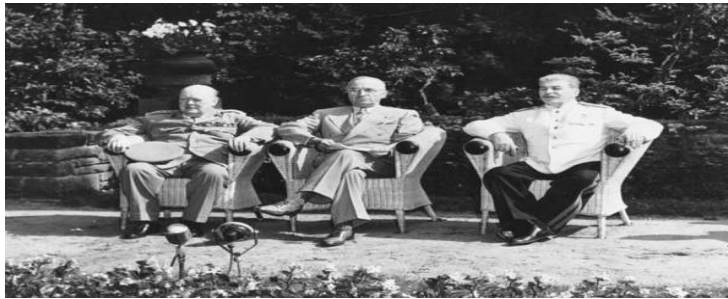
Churchill, Winston; Truman, Harry; Stalin, Joseph